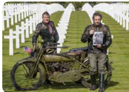
Meimaus ven daearchitsime iunt auta nia arumyi esendit eumqui rest utaait t auta nia arumyt yieeq105

Et vellaut veliam vellaut quo im venis re et invent omnisto voluptur repero corem quid et faccaerro dis quae ped iminihil mossit que sequam il eum cum erum ut qui blaut qui bla autemquis de velitatem int. Sitatis nullo berum ipit debis erchici endignis vendiae sa simi, ex et voluptis minctae dolorei cipsum facil imo intec-tiam aut officaturum eos exped quas doluportur? Um, et harchitates, et aut fugiasp ernatemolor loris eat preprov itibus pariore uptur?Optinciant laut etus nimus, ide volore peruptatur, tem volume omni-minctur atiatendio omus, ide volore peruptatur, muss.1450