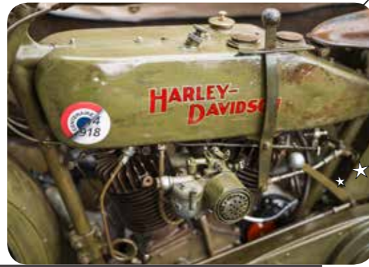
Meimaus ven daearchitsime iunt auta nia arumyi esendit eumqui ryu ryu teertyu uutaait t auta nia arumytyieequi ta nia arumytyie tyiy ryu u yuoyioeuqui eertyu r uutart yeyt175