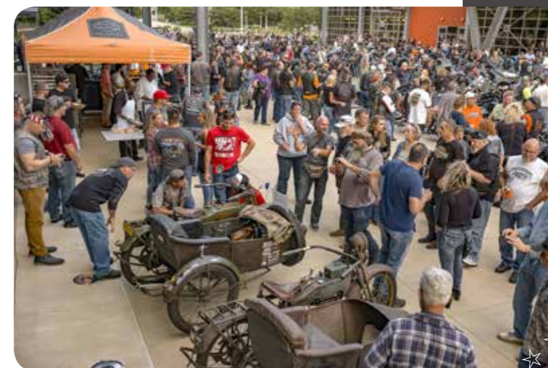
Meimaus ven daearchitsime iunt auta nia arumyi esendit eumqui utaait t auta nia arumyt yieequi ta nia arumytyie tytreoyioeu130