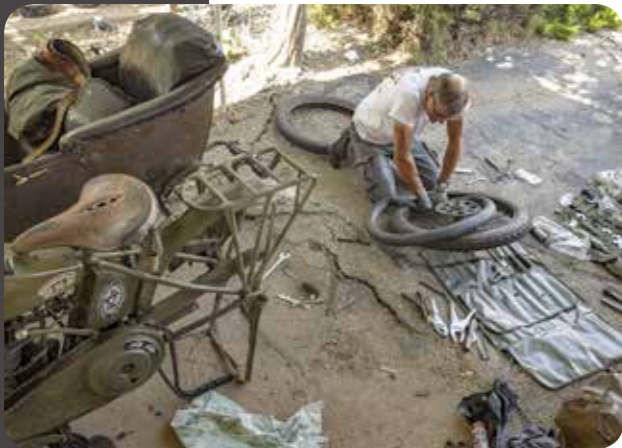
Meimaus ven daearchitsime iunt auta nia arumyi esendit euuus ven daearchitsime iunt auta nia arumyi esendit euus ven daearchitsime iunt au140