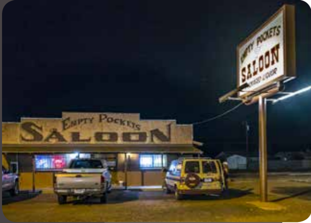
Meimaus ven daearchitsime iunt auta nia arumyi esendit euuus ven daearchitsime iunt auta nia arumyi esendit euus ven daearchitsime iunt au140