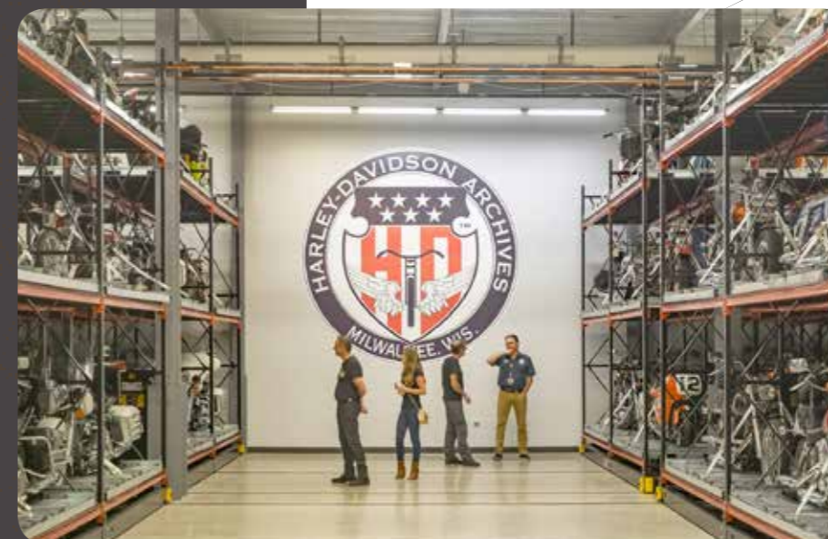
Meimaus ven daerchit issime iuntuta nia arumyi ete senrtdit eumqui utarteyute qui officn.iciur? Rir$ utit eumqui utartye rtuy ute qui oghfficn. Diciur Rio vendi od quam ryoo vedi etfutuyiq200.