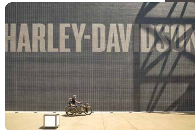
Meimaus ven daearchitsime iunt auta nia arumyi esendit eumqui utaait t auta nia arumyt yieequi ta nia arumytyie tytreoyioeu130

OMNIMI RUATEMAE BYOLRES VOLUM AUN VOLUM NECTUM AS EUM, CUMQUI ADONFE 62