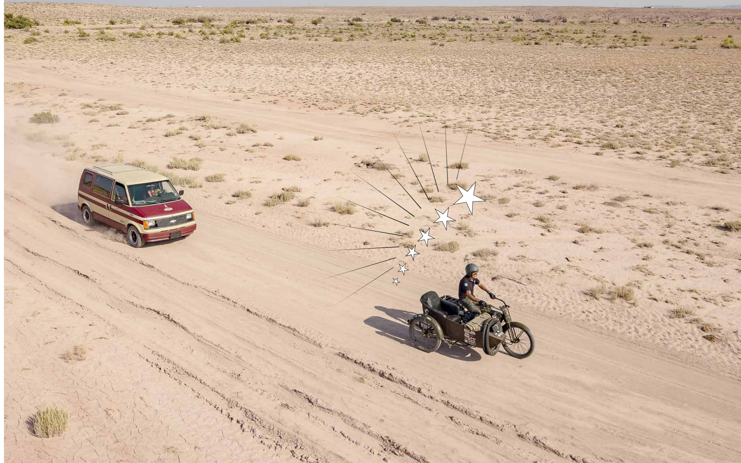
Meimaus ven daerchit issime iuntuta nfia arumyi ete senrtdit eumqui utarteyute qui officn.iciur? Rir& utit eumqui utartye rtuy ute qui oghffcn.i 150