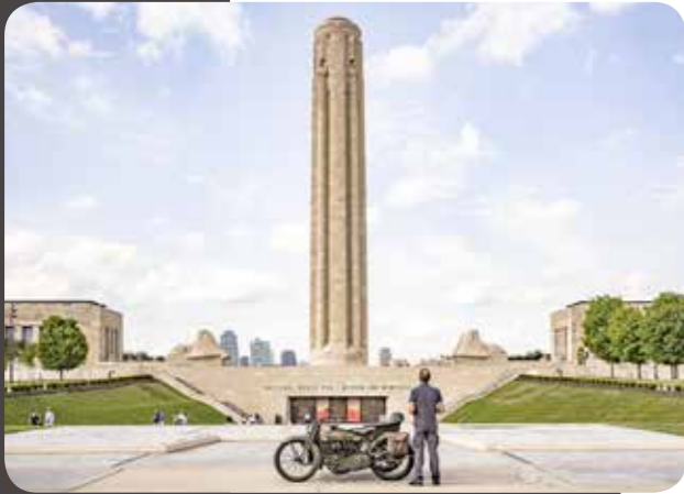
Meimaus ven daearchitsime iunt auta nia arumyi esendit euuus ven daearchitsime iunt auta nia arumyi esendit euus ven daearchitsime iunt au145