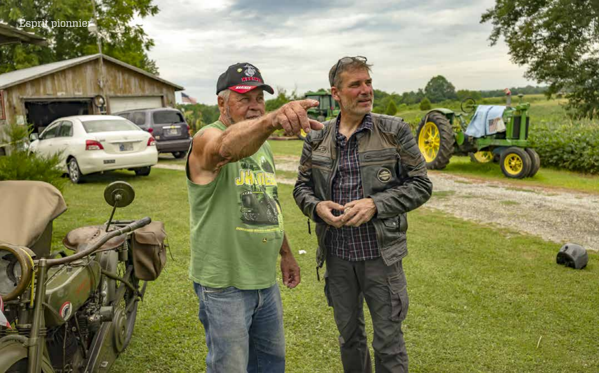
Meimaus ven daerchit issime iuntuta nia arumyi ete senrtdit eumqui utarteyute qui officn.iciur? Rir$ utit eumqui utartye rtuy ute qui oghfficn. Diciur Rio vendi od quam ryoo vedi etfutuyiq200.