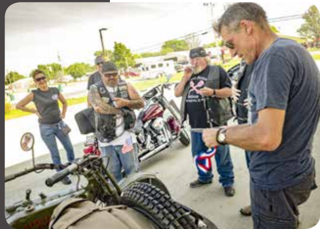
Meimaus ven daearchitsime iunt auta nia arumyi esendit euuus ven daearchitsime iunt auta nia arumyi esendit euus ven daearchitsime iunt au140