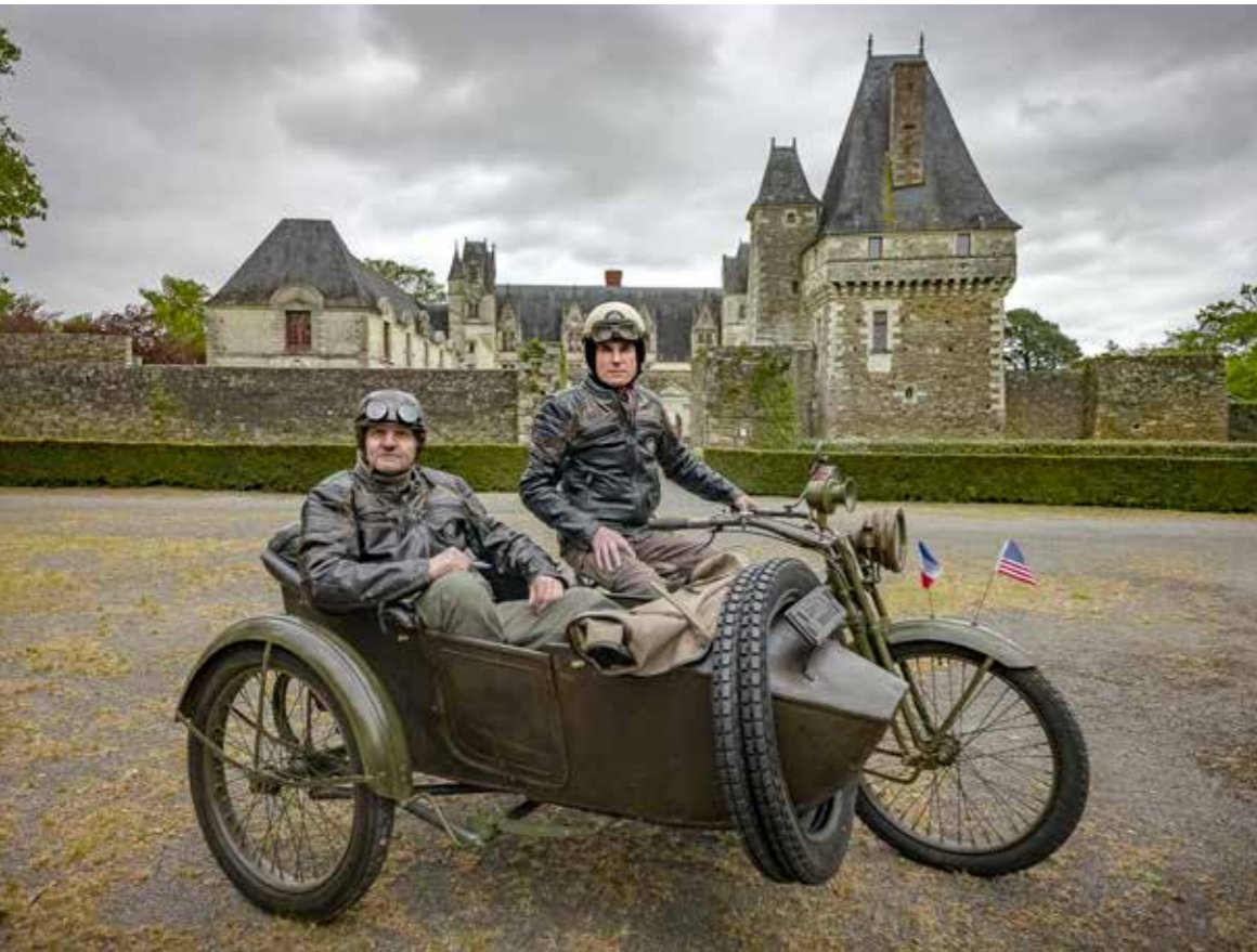
Meimaus ven daerchit issime iuntuta nia arumyi ete senrtdit eumqui utarteyute qui officn.iciur? Rir& utit eumqui utartye 130

OMNIMI RUATEMAE RESBYL VOLUM AUN VOLUM NECTUM AS EUM, CUMQUI INTIMU70