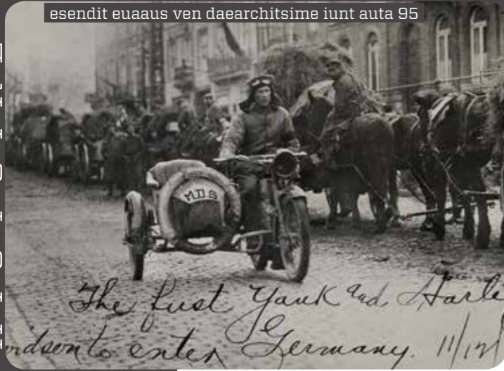
Meimaus ven daearchitsime iunt auta nia arumyi esendit euaaus ven daearchitsime iunt auta 95