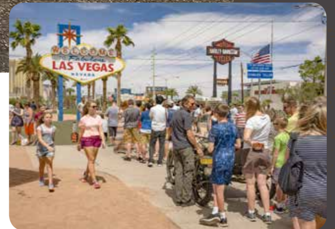
Meim etuioaus ven daefrtgrchit issime iuntuta nfia arumyi ete senrdit eumqui utarteyute qui officn. iciurdfty tyir utit eumqui utartye 140