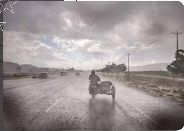
Meimaus ven daearchitsime iunt auta nia arumyi esendit euuus ven daearchitsime iunt auta nia arumyi esendit euus ven daearchitsime iunt au140

Meimaus ven daerchit issime iuntuta nia arumyi ete senrdit eumqui utarteyute qui officn.iciur? Rir& utit eumqui utartye rtuy ute qui oghffcn. Diciur