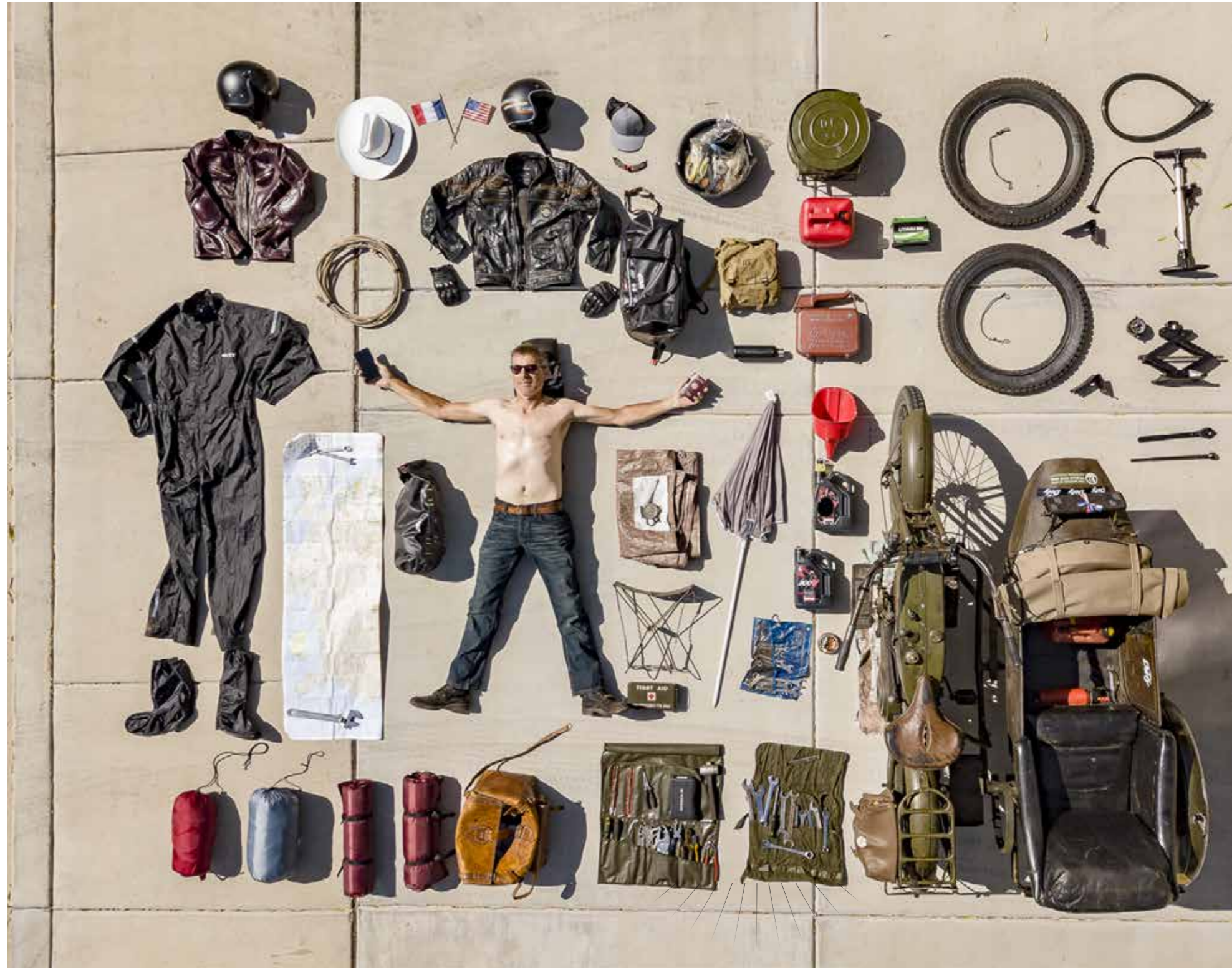
Meimaus ven daerchit issime (1) iuntuta nia arumyi ete senrtdit eumqui utarteyute qui offi rucn. iciur? Rir& utit eumqui utachit (2) issime iuntuta nia arumyi ete senrtdit eumqui (3) utarteyute qui officn.iciur? Rir& utit eumqui utartye rtuy ute qui oghffcn. Diciur Rio vendi od quam ryoo zr&uvedi efutyiq200. eumqui (4) utartye rturtye rtuy ute quichit issime iuntuta (5) nia arumyi ete senrtdit eumqui utarteyute qui officn.iciur? Rir& utit eumqui utartye rtuy ute qui oghffcn. (6) Diciur 500.